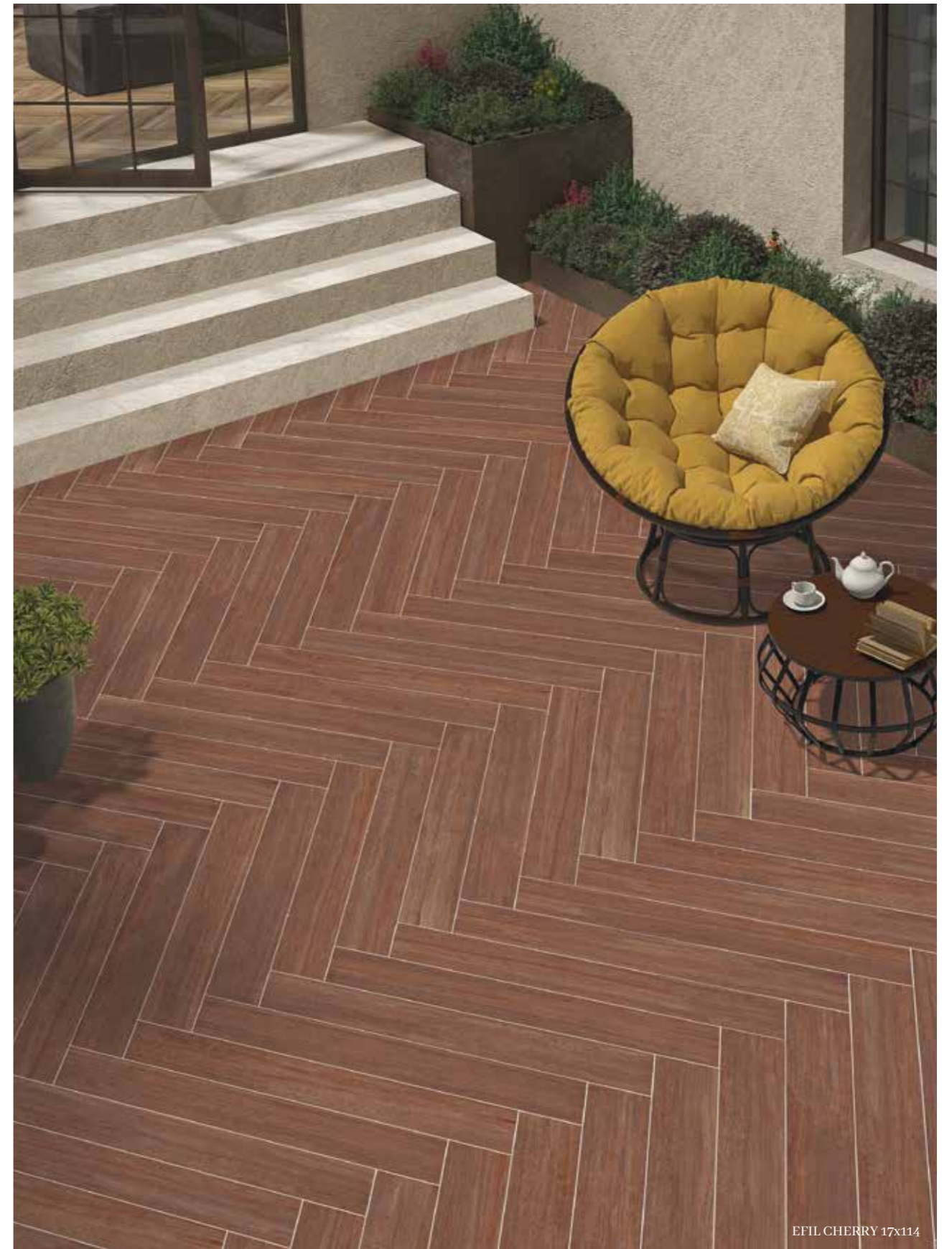
EFIL CHERRY 17x114