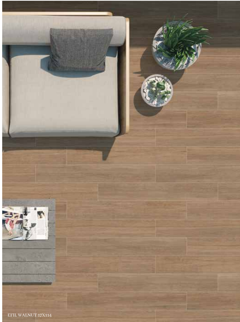
EFIL WALNUT 17X114