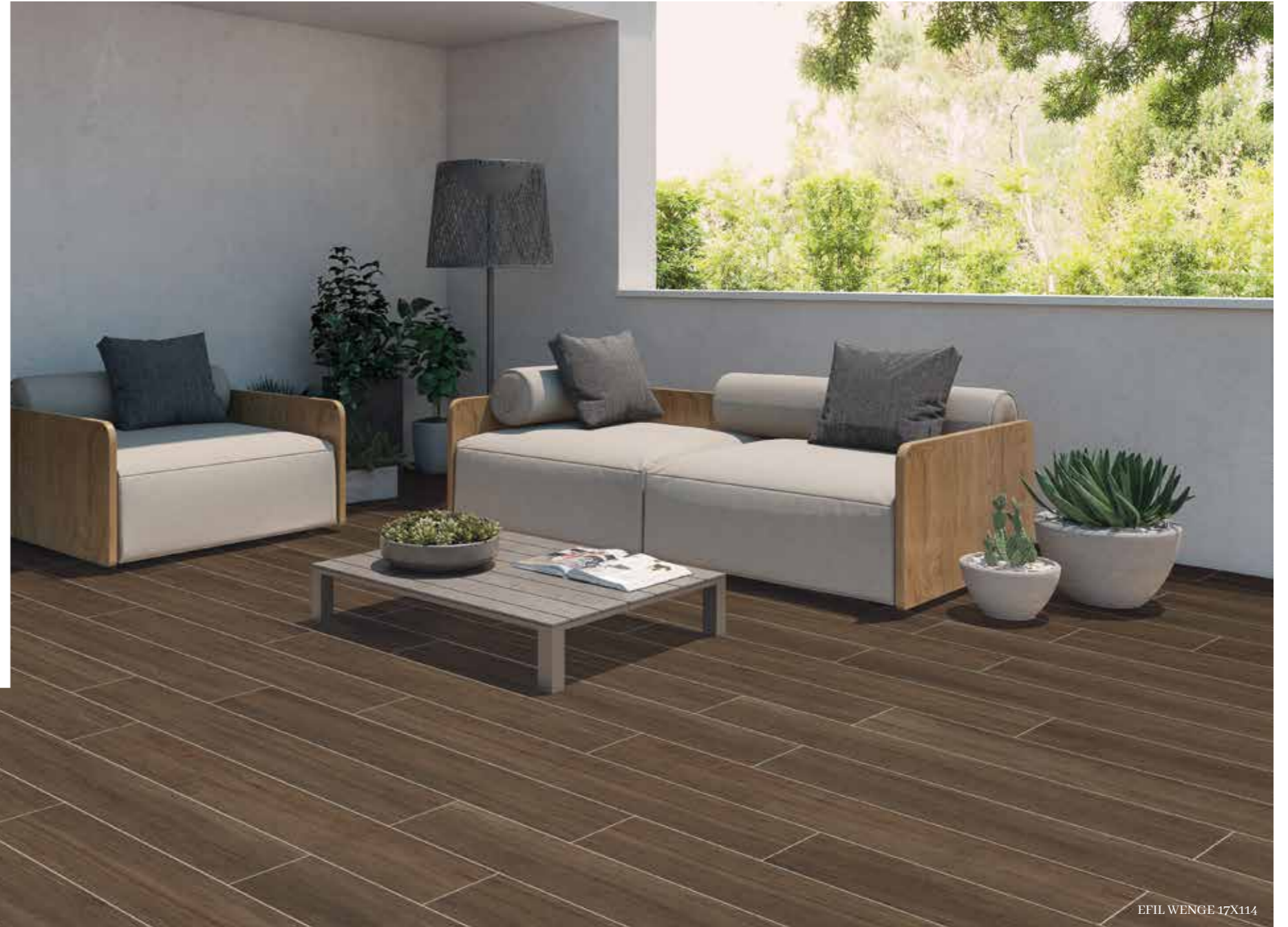
EFIL WENGE 17X114