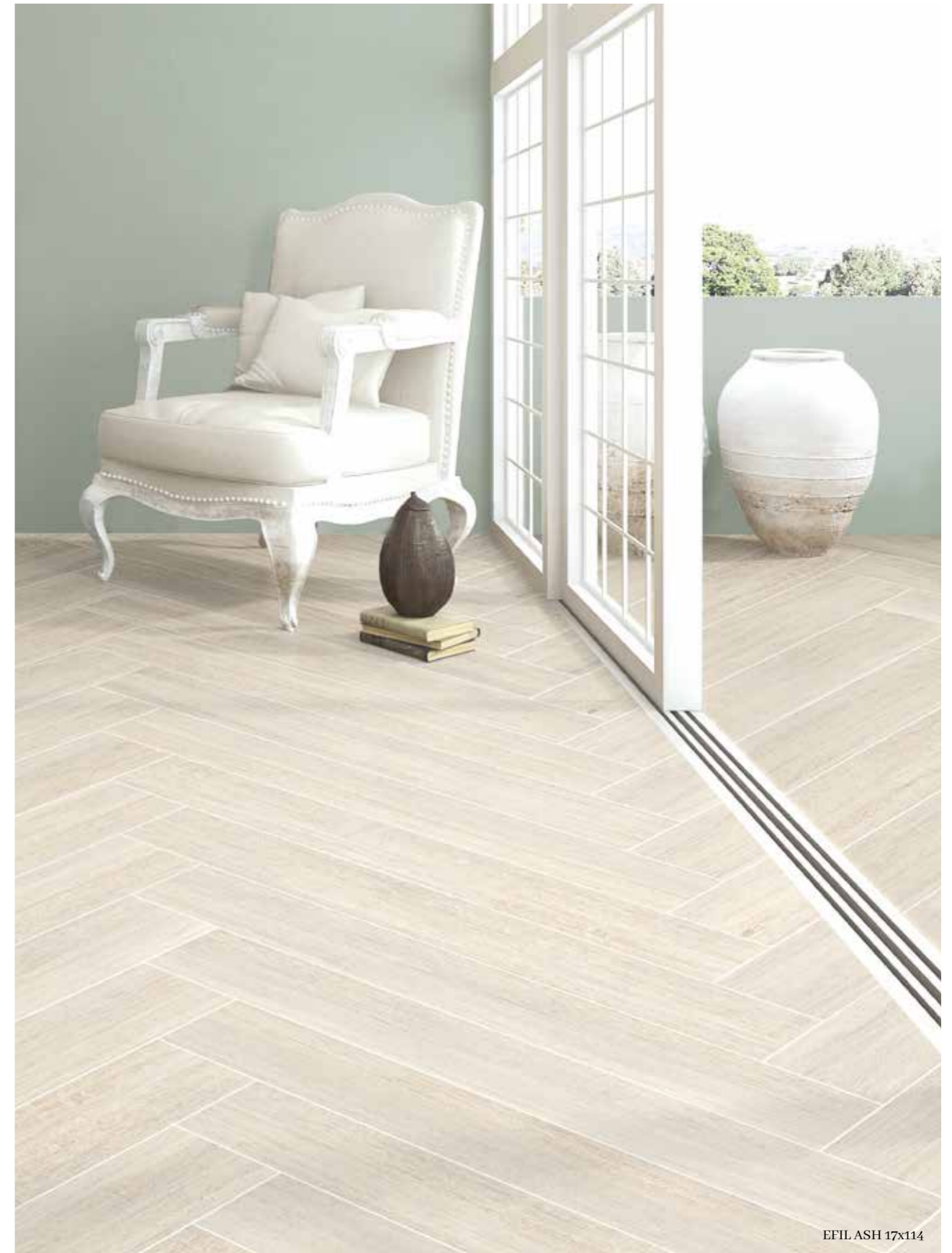
EFIL ASH 17x114