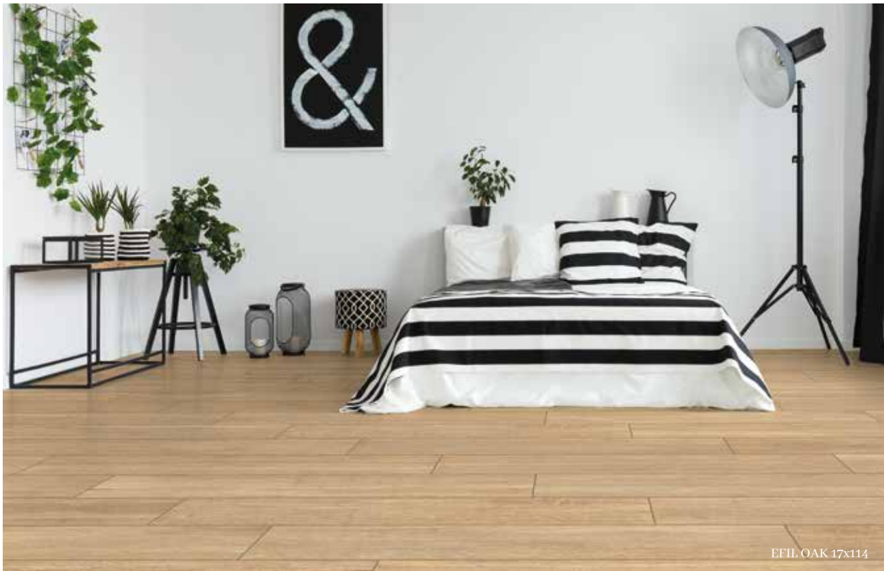
EFIL OAK 17x114